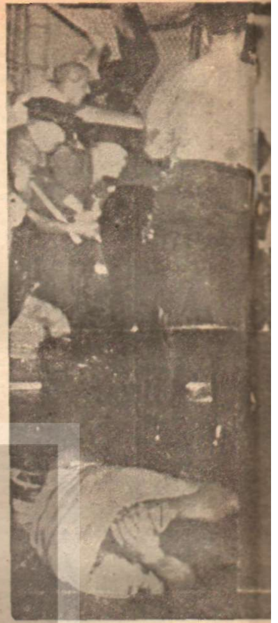
Amerika'da bir zenci grup

Yeni radikallerin az bir kısmı, kabul edemedikleri Amerika için açık seçik çözümlere sahiptirler. Bazıları, sosyalizmin çeşitli biçimlerine yönelmişlerdir. Otuz yıl dan beridir bu doktrine bugün daha fazla ilgi vardır. Sosyalistliklerini ilân edenler,